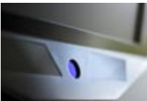
Apparative Marktforschung: Bei phaydon im Einsatz - modernste kontaktfreie Eye-Tracker zur Blickregistrierung