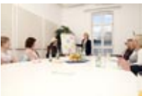
Qualitative Marktforschung: Gruppendiskussion im phaydon Teststudio, Köln