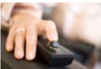
Apparative Marktforschung: Verlaufsbeurteilung mit Schieberegler im phaydon Teststudio, Köln