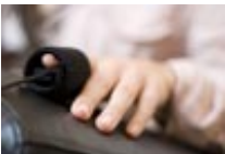
Apparative Marktforschung: psychophysiologische Aktivierungsmessung mittels Pulssensor im phaydon Teststudio, Köln