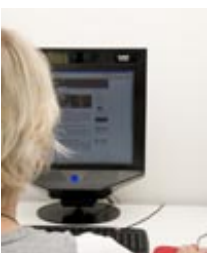
Usability Forschung: Test einer Internetseite mit Blickregistrierung durch kontaktfreien Eye-Tracker im phaydon Teststudio, Köln